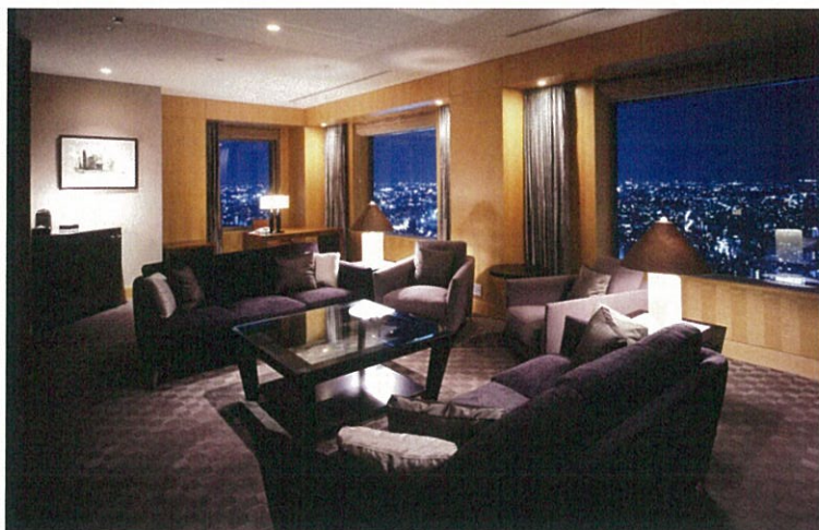
プレジデンシャルスイート リビングルーム