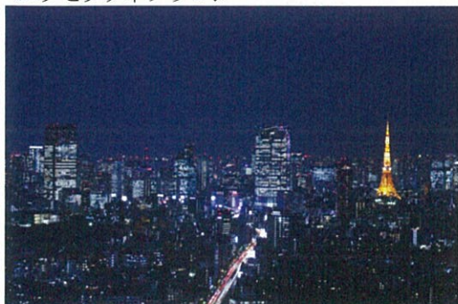
客室からの夜景イメージ