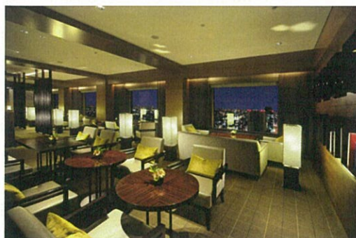
エグゼクティブサロン

TEL: 03-3476-3000 (客室予約) または インターネット http://www.ceruleantower-hotel.com/room/plan/2011-2-1-1.html#point ※「スイートステイ」についてはお電話にてご予約を受け付けております。