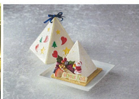
プラン限定クリスマスケーキ