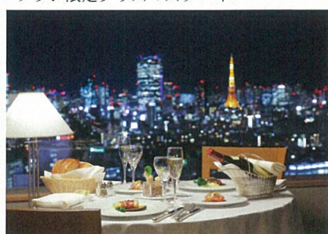
ルームサービスイメージ