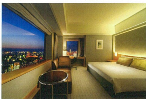
タワーズフロア キングルーム