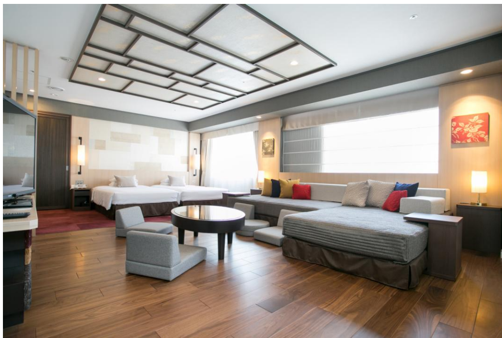
大きなソファがベッドに変わる広々とした空間には和のテイストが所々に散りばめられている

60㎡の広々とした空間には、壁や天井、カーテン、クッション、クローゼットに至るまで和のテイストを随所に取り入れており、洋室でありながら和室にいるような寛ぎを感じていただけます。床はフローリングになっていて、靴を脱いで部屋に上がり、テーブルを囲めば自宅にいるような感覚を味わえる癒しの空間が広がっています。