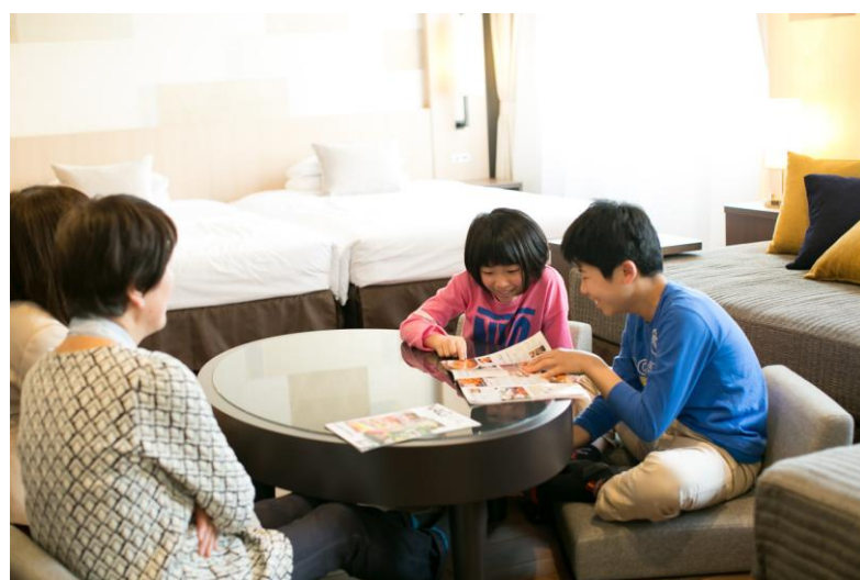
まるで自宅にいるようなゆっくと家族団欒を楽しめる空間