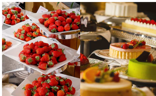
「いちごジャーニー」イメージ

フレッシュないちご約6銘柄の食べ比べ ができるほかショートケーキやタルト、グラスデザートなどのいちごスイーツをご用意(内容は時季により変更あり)。さらに、4月のアクションコーナーでは、ご注文に応じて目の前で「ミルフィーユ オフフレーズ」をお作りします。