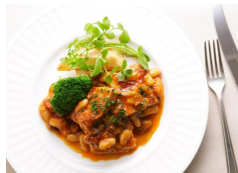
白いんげん豆と豚肉の煮込み “カスレ” (フランス)