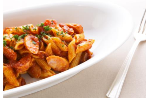
ペネアラビアータ (イタリア)