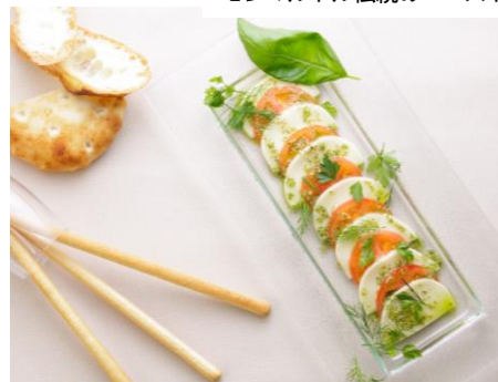
カプレーゼ (イタリア)