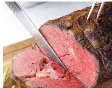
モンマルトル伝統のローストビーフ (イギリス)