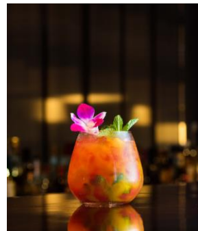
トロピカルモヒート