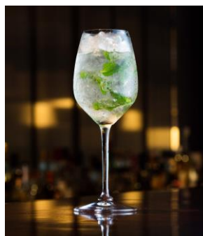
シャンパンモヒート