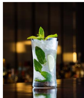
ダブルミントモヒート

ザ・キャピトルホテル 東急 マーケティング : 川邊(かわべ) Tel : 03-6206-1576(マーケティング 直通) E-Mail : capitol-h.mk@tokyuhotels.co.jp