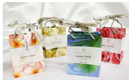
バスソルトイメージ