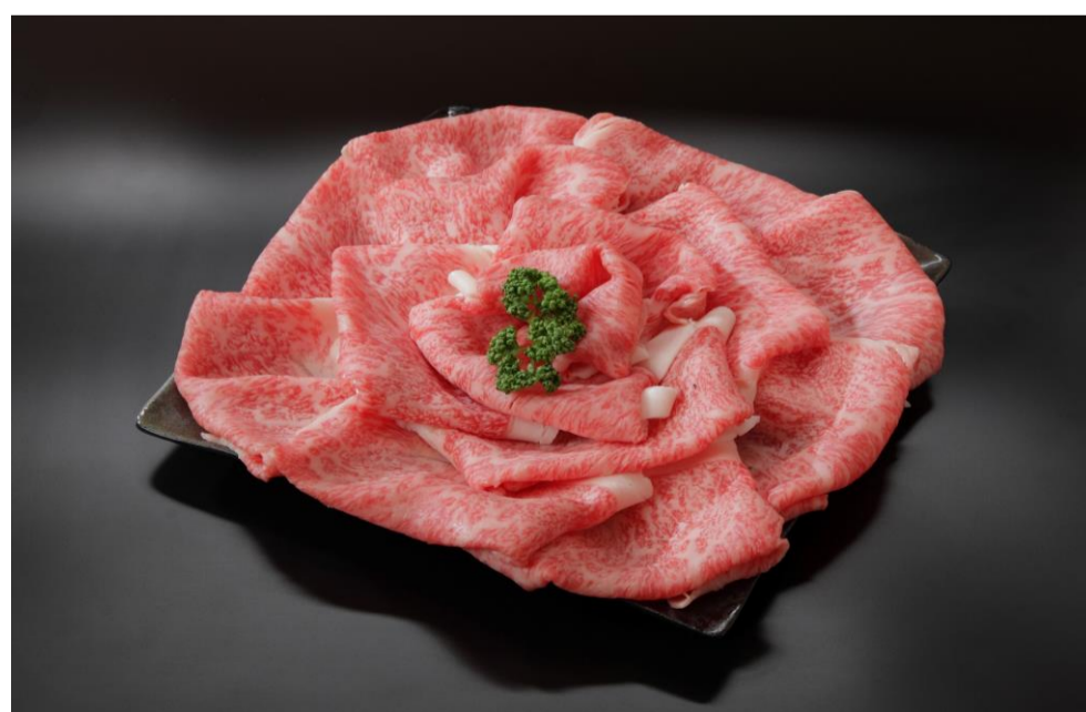
⑦小林市産宮崎牛A5等級ロース しゃぶしゃぶ用