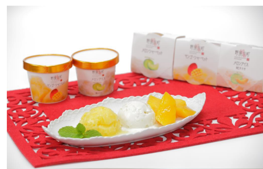
⑨冷え冷えマンゴーちゃん