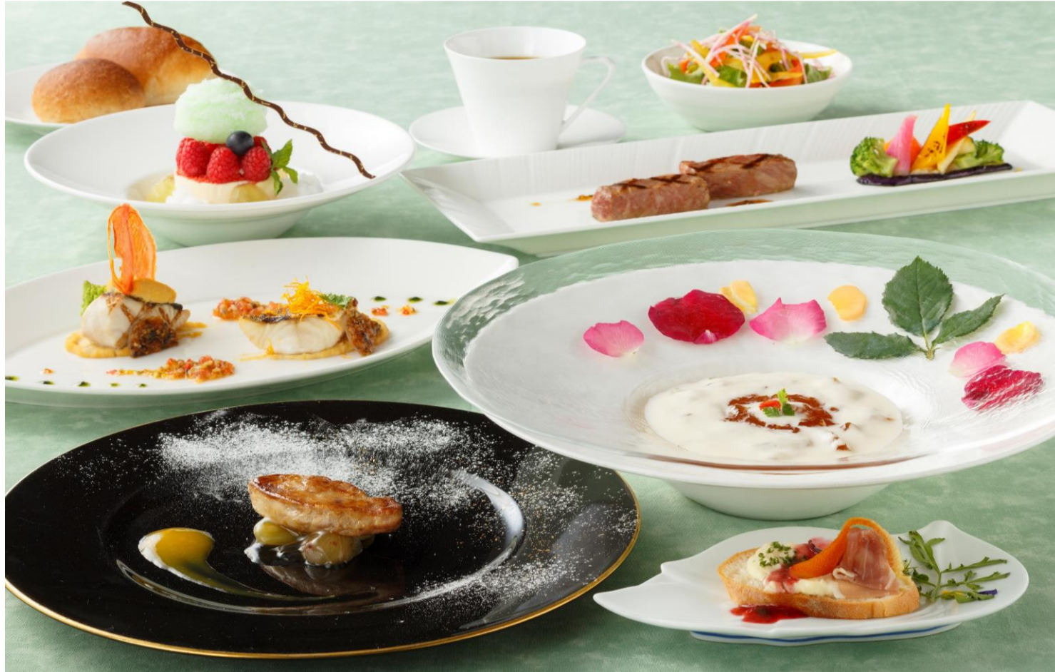
①エクセレントディナー