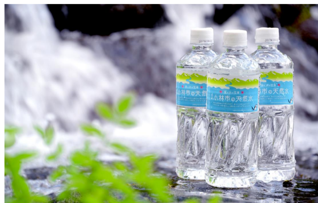
⑥宮崎小林市の天然水