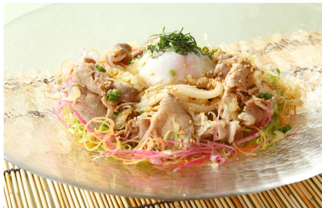
③冷やし豚しゃぶうどん 麦味噌だれ