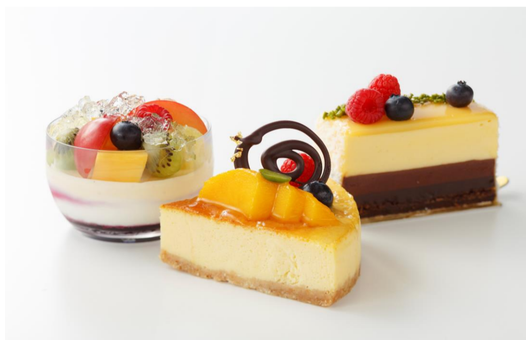
⑤ケーキ(左よりクレール・マンゴーヨーグルト ・ショコラエテ)