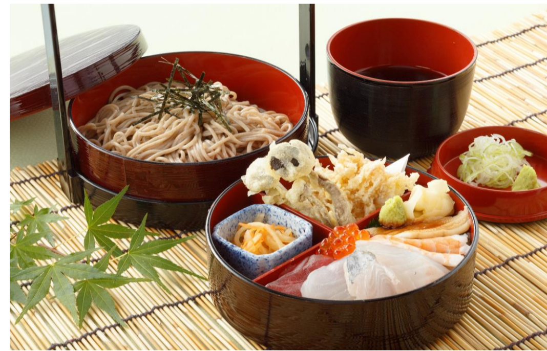
④冷やし蕎麦・ミニ海鮮丼(小林市名産チョウザメ入り) ・きのこの天婦羅