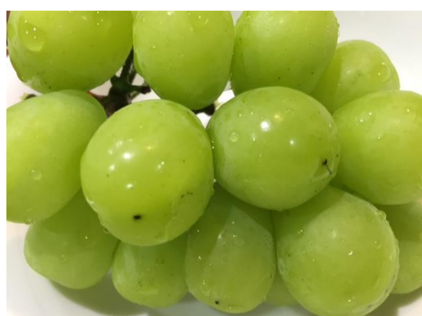
⑧旬のぶどうセット