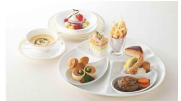
洋食お子さまランチイメージ写真