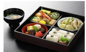
松花堂弁当イメージ写真