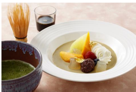
デザートイメージ