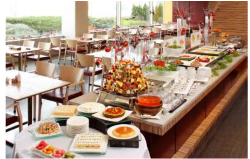
クリスマスランチbuffet