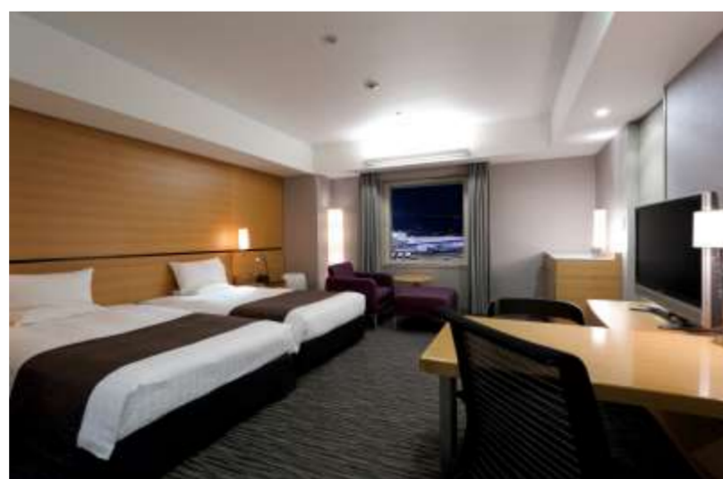
エクゼクティブツイン