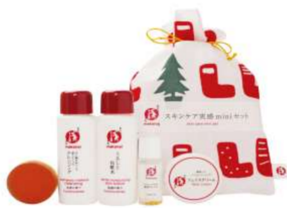
まかないこすめ実感miniスキンケアセット