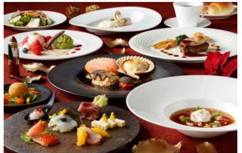
クリスマスディナー