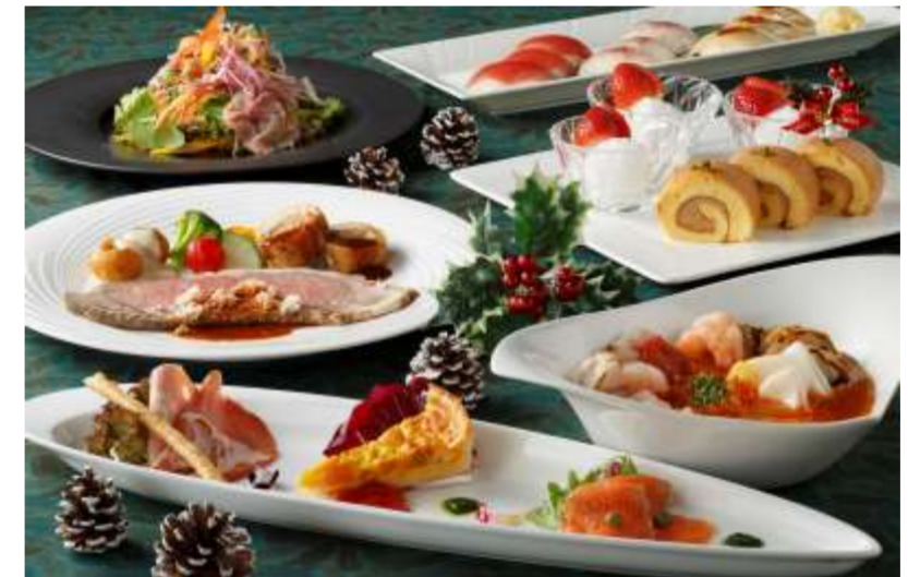
クリスマスファミリーディナー