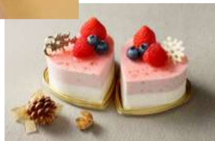
スパークリングワイン&ムース・オ・フレーズ