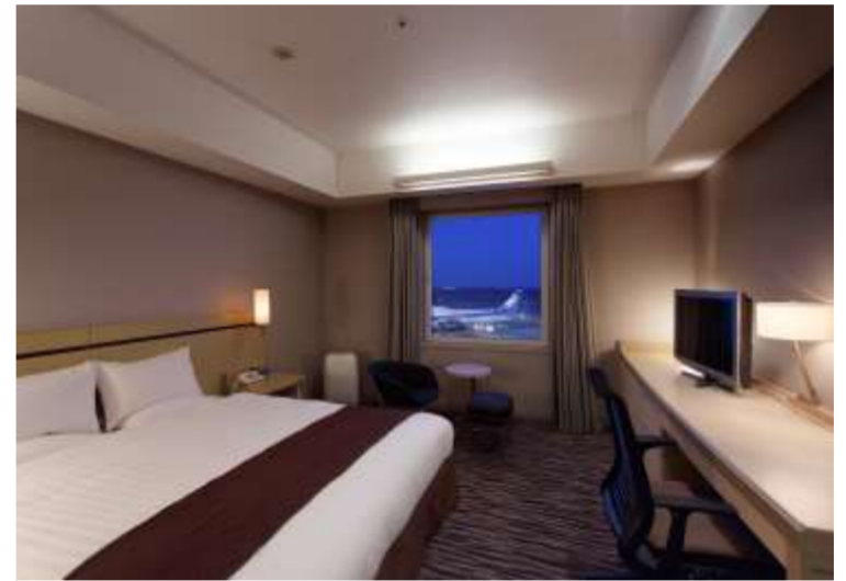
プレミアムダブル(滑走路側)