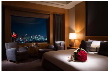
スイートステイ：ベッドルームイメージ