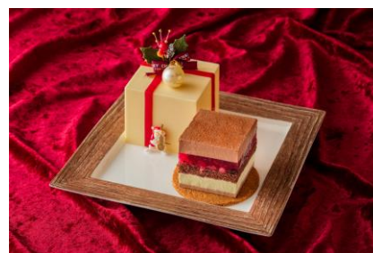
プラン限定 クリスマスケーキイメージ