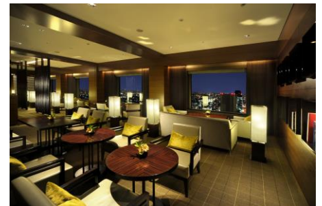
エグゼクティブサロン

「セルリアンフロア」「タワーズフロア」にご宿泊のお客さま専用のサロン。 ブッフスタイルのご朝食からティータイム、カクテルタイムなど様々な シーンでご利用いただけます。書籍、雑誌、新聞等のご用意の他に、 ミーティングスペースもご用意。ご滞在中、専任スタッフによるきめ細やかな サービスをご提供いたします。