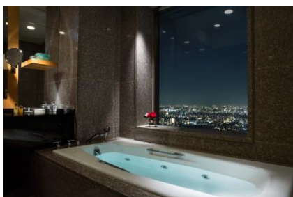
スイートステイ：ビューバスイメージ