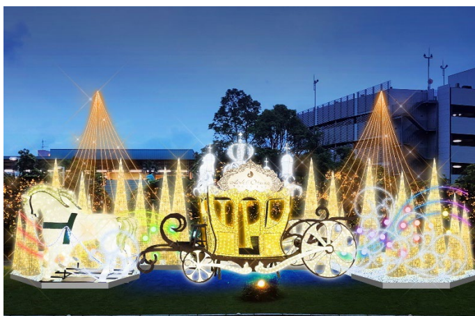
【輝きの馬車】 物語の世界から抜け出したような「輝きの馬車」