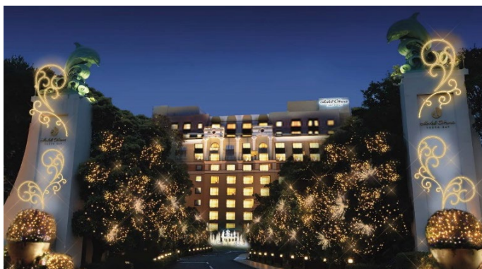
【シャンパンゲート】 シャンパンをイメージしてイルミネーション装飾されたドルフィンゲートと並木道