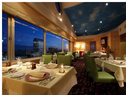
プライベートダイニング シェルブルー