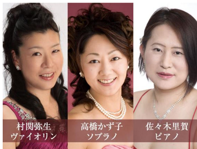
村関弥生 ヴァイオリン