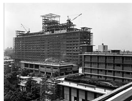
本館からみた別館工事風景

2015年9月から開始される現本館建替え工事期間終了の2019年春まで、その強みを維持し、本館の4つのレストラン、バーを別館に移設、機能を結集した体制にてホテル営業を継続してまいります。