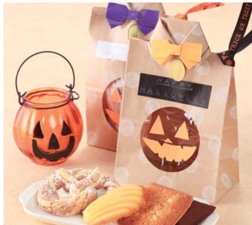
ハッピーハロウィンパック ※飾りは付いておりません。