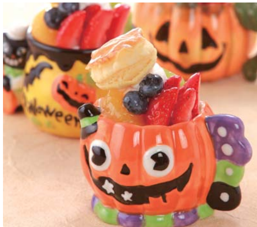
パンプキンプリン “ハロウィン”