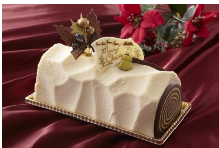
ホワイトショコラ “ノエル” 4名様用： ¥ 3,900