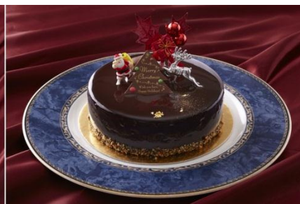
クリスマスショコラ “グアナラ” 4名様用： ¥ 3,950