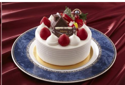
クリスマスショートケーキ 4名様用： ¥ 3,800