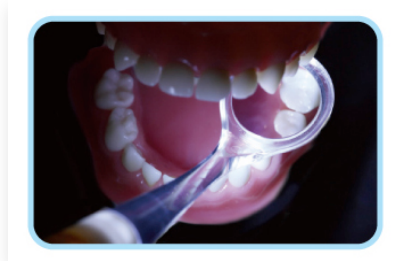
図 1 通常では見えない部分の汚れも確認できます。