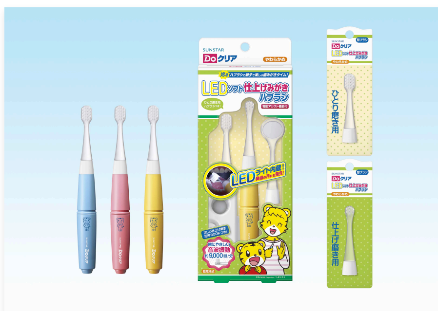
Doクリア LED ソフト仕上げみがきハブラシ

LEDライトがお子様のお口の奥まで明るく照らし、やさしい音波振動で効率よく歯と歯ぐきを傷つけず、みがけます。さらに、デンタルミラーを使うことで気になるみがき残しのチェックもできます。製品には『こどもちゃれんじ』が持つ、幼児の歯みがき習慣化のノウハウを紹介した冊子を同梱し、仕上げみがきに悩む保護者の方をサポートします。