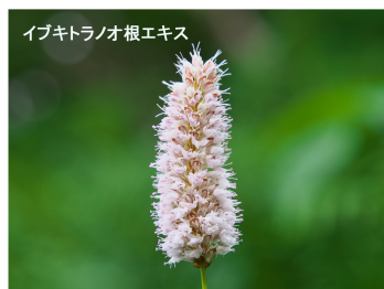
イペイトロノ根エキス