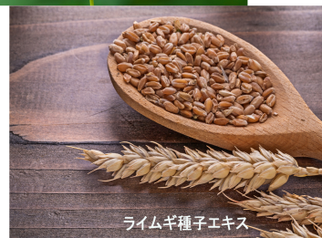
ライムギ種子エキス