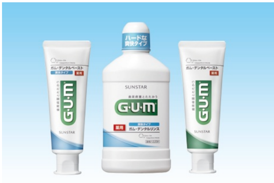
ガム・デンタルペースト 爽快タイプ

トータルケアで歯周病菌とたたかう「G・U・M」として、より効果的な歯周病対策のためにラインナップを拡充します。