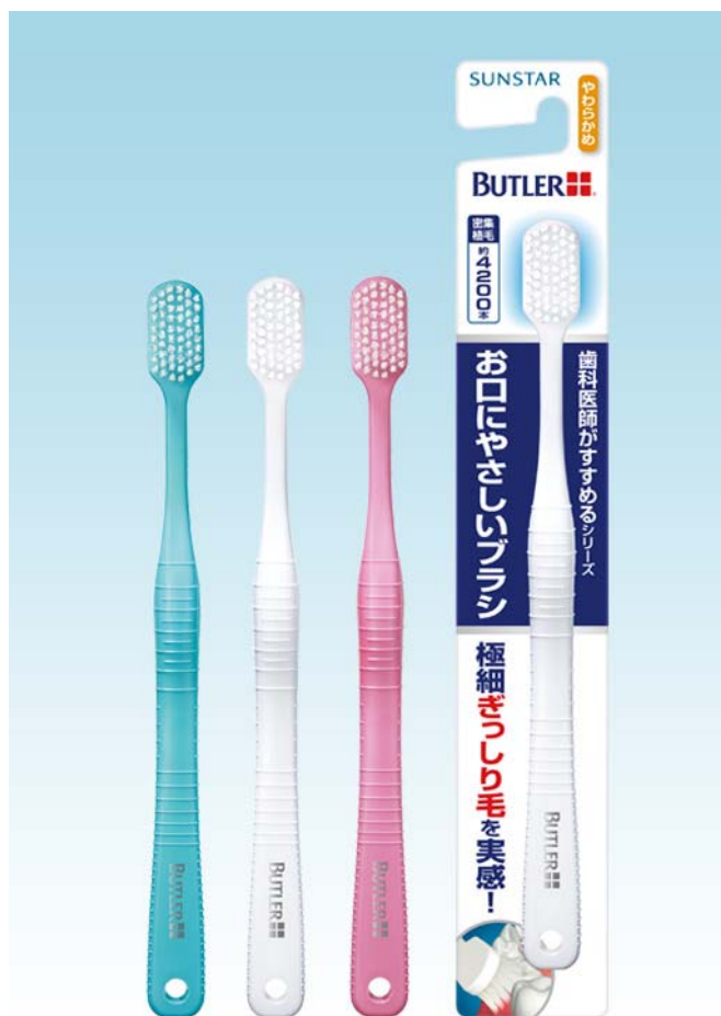
「バトラー お口にやさしいブラシ」

サンスター株式会社（本社：大阪府高槻市、代表取締役社長 吉岡貴司、以下サンスター）は、歯科医師がすすめるブラシシリーズとして、幅広ヘッドと約 4,200 本の極細ぎっしり毛（密集植毛）で、みがきたいところにあてやすく、やさしいタッチでみがくことができる「バトラー お口にやさしいブラシ」を 2015 年 3 月 16 日（月）より全国で発売いたします。自分自身で細かく丁寧にみがくことができない方でも使いやすい設計で、歯とハグキをやさしくみがきあげます。