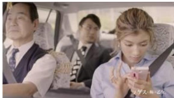
【CM カット「満たされないオンナ」篇】