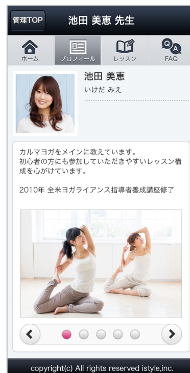
【“プロシューマー” プロフィール TOP】