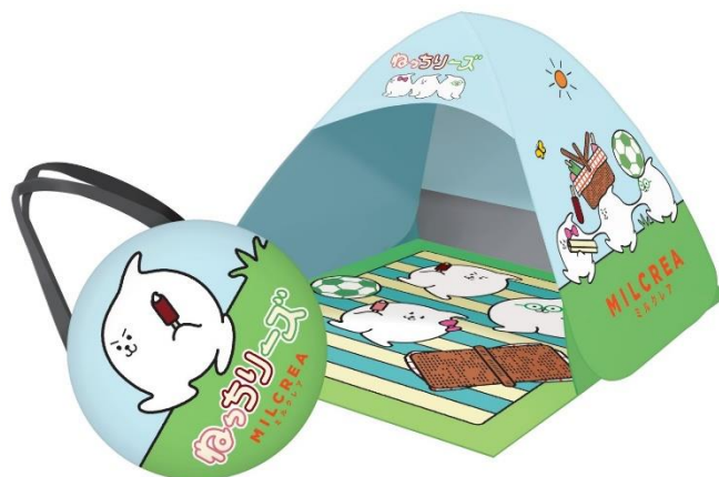
※「ポップアップテント」イメージ