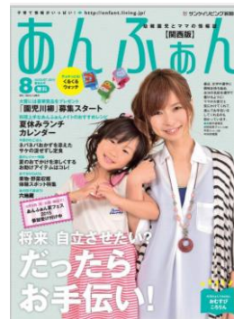
幼稚園児とママの情報誌 「あんふあん」 幼稚園を介して配布

大阪で一昨年夏、初めて「ランドセル大展示会」をメインコンテンツとして開催。昨年も大好評となり、今年は会場を倍の広さにして実施します。今年は、「ランドセル大展示会」のほか、人気キャラクターやパフォーマーが登場するステージショー、子どもたちが描いたぬり絵がスクリーンで動き出すワークショップなども用意しています。※事前予約申し込み制。