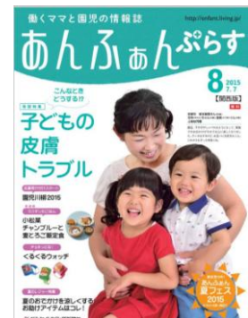
働くママと園児の情報誌 「あんふあんぷらす」 保育園を介して配布