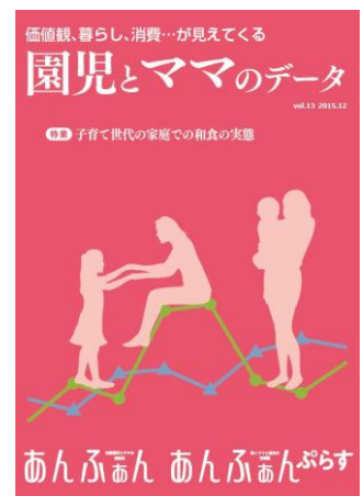
A4判 72ページ (1500円・税込み)

幼稚園ママと保育園ママとで違いが出た項目については相違点を比較しています。今のままの気持ちが一冊で丸分かりの「園児とママのデータ vol.13」をどうぞご利用ください。