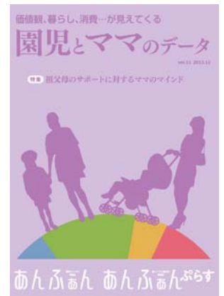
A4判 68ページ 1500円(税・送料込み)

調査方法：WEBアンケート。調査対象：全国のあんふあん Web、リビング Web、シティ Web のメールマガジン読者のうち、幼稚園児・保育園児のいる人。調査実施時期：2013年5月23日～6月5日、集計数：333件