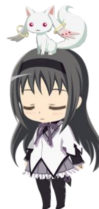
限定アイテム[キュウベエの人形]イメージ