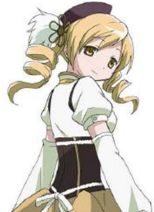
スキルカード[氣遣うマミ]起用イラストイメージ