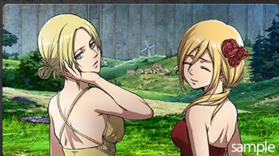
クリスタ・アニ「祭典用特注礼装」クリアファイル

当選者は、限定15名様! プレミアムグッズを手に入れよう!! 限定クリアファイルプレゼント!!