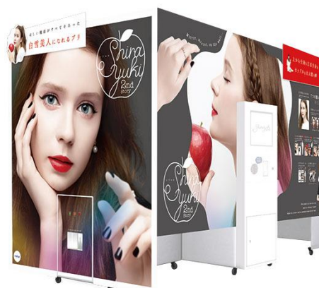
『Shirayuki 2nd Story』本体イメージ