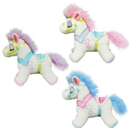
ベビーパレードぬいぐるみ～ユニータ～ 2016年3月上旬展開予定 (全3種/約25cm)