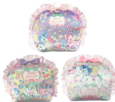
ベビーパレードフリルポーチ 2016年3月上旬展開予定 (全3種/約17cm)