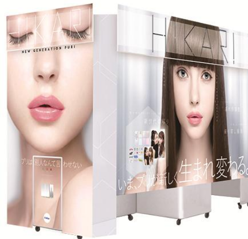
プリ機『HIKARI』外観イメージ