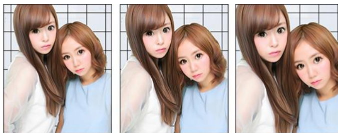
【カメラと被写体の距離/背景のぼけ具合】

プリ機『HIKARI』背景合成イメージ カメラと被写体の距離が近づくほどに背景の柄がぼやけ、より奥行き感が出る仕様となっております。