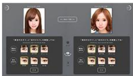
「FACEレタッチ」 操作画面イメージ

撮影後、画像に装飾を行う落書きブースにて、【顔と目の大きさ】・【黒目の大きさ】・【目の形】・【肌の明るさ】・【チーク・リップの色味】を各3段階から自分好みに調整することのできる「FACE レタッチ機能」を搭載。変化していく自分の顔を画面で確認しながら操作することができ、より自分の理想に近い顔に仕上げることが可能です。