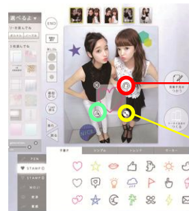
◆プリ機『HIKARI』落書き画面イメージ 従来のプリ機同様、タッチペンにて操作

右上回転アイコン タッチしたまま回転させることで、画像の角度を変更することが可能