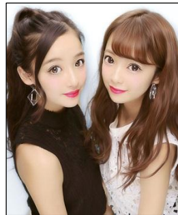
2015年11月中旬発売 『KATY(ケイティ)』仕上がりイメージ

加えて、撮影ブースに設置している照明の照射角度、光の量を調整することによって、画像全体に立体感/奥行き感を与えます。