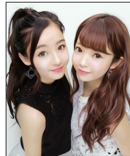
2016年3月中旬発売 『HIKARI』仕上がりイメージ