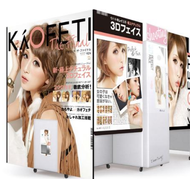
カオフェチ・ザ・ファイナル

カオフェチ mobile の対象機種:NTTドコモ・KDDI・ソフトバンクのフィーチャーフォンおよび iPhone® ・Android™ 対応端末 (ウィルコム端末は非対応です)