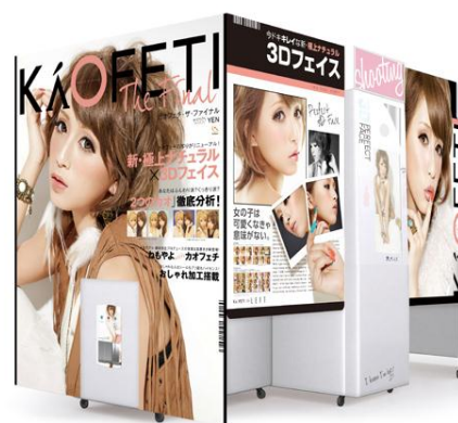
シリーズ最新機種！7月19日発売 「カオフェチ・ザ・ファイナル」外観

「KATE」ならではのコンテンツを使いながらブランド・商品を体験できます。「KATE」をイメージした背景で撮影し、落書きコンテンツでは実際の「KATE」商品と同じカラーの“チークスタンプ”で、メイクをするように落書きを楽しむことができます。