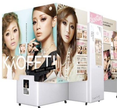
カオフェチ SECOND ISSUE