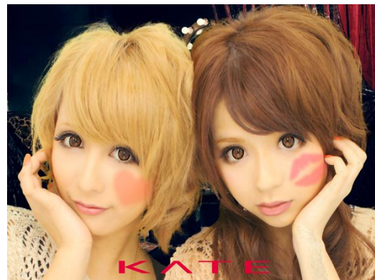
KATE コラボの背景とチークスタンプ使用時のイメージ