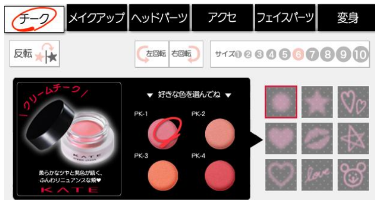
「KATE」のクリームチークが登場する落書き画面