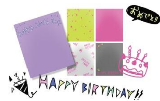
「プロフセレクト」シーケンスイメージ