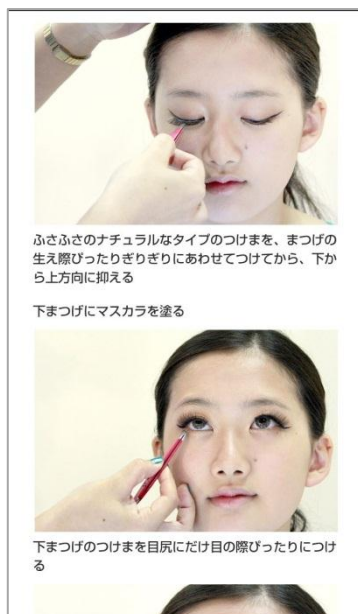
雑誌よりも詳しい メイクアップ工程