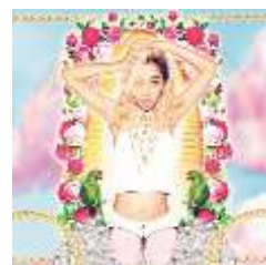
“Lonely Angel” 通常盤 ジャケットイメージ