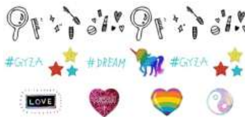
『GYZA2』コラボスタンプ例