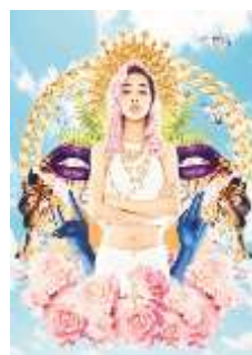
“Lonely Angel” 初回限定盤 ジャケットイメージ

http://www.universal-music.co.jp/aoyama-thelma