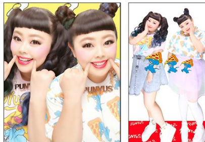
サンプルポーズ 例