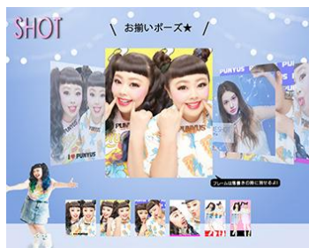
撮影画面イメージ