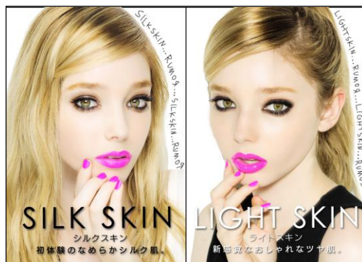
写りのコース選択画面 ▶

『RUMOR』発売直後から、写りについての市場調査を実施し、今作ではユーザの意見を前作以上に写りへ反映しました。まるでスタジオで撮影したかのような、ユーザ理想の加工感の少ない自然な写りを実現しました。