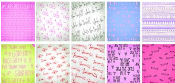
▲ リニューアル背景一例

『RUMOR』のファッションブルでスタイリッシュな背景 & 落書きが大幅リニューアル。写りを最大限に活かす色味とコンテンツで、かつてないハイセンスな仕上がりを実現します。