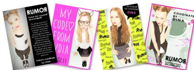
▲ 「コーデピン撮」デザイン一例