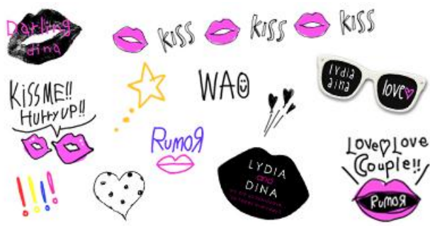
▲ リニューアル落書き一例