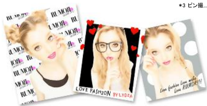
▲ 「盛れるピン撮」イメージ

*3 ピン撮...2人同時に1人ずつの画像が撮影できる機能および、その機能で撮影した画像のこと。 *4 コーデピン撮...その日のコーディネートを残せるデザイン入りのピン撮のこと。