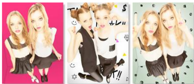
▲ 「盛れる全身」イメージ