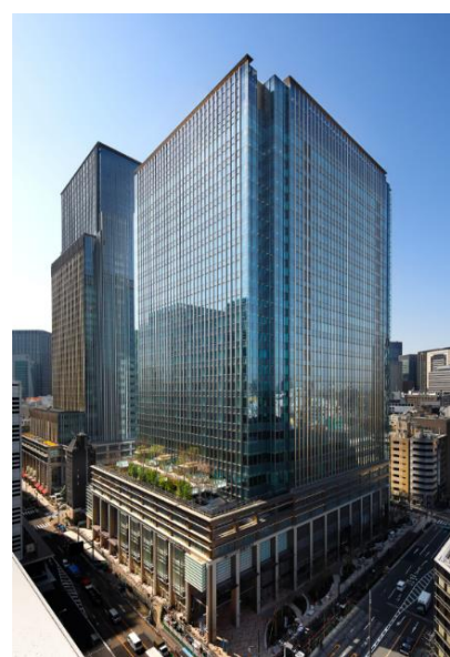
日本橋室町三井タワー