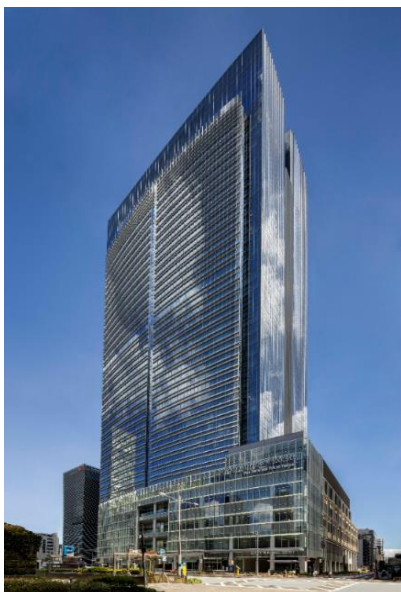
東京ミッドタウン八重洲 八重洲セントラルタワー