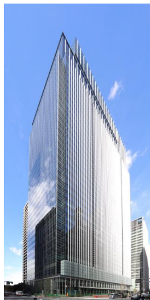
Otemachi One タワー