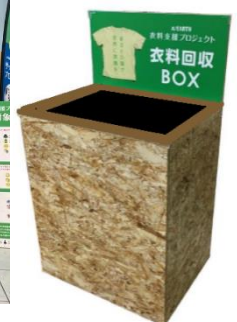
前回の衣料品回収風景(2023年5月)