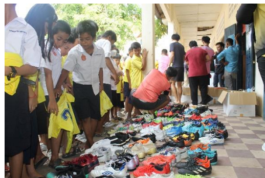
カンボジアでのサッカー用品寄贈の様子(2023 年 6 月)