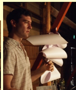
▲島民とのなごやかなワークショップも3回開催！