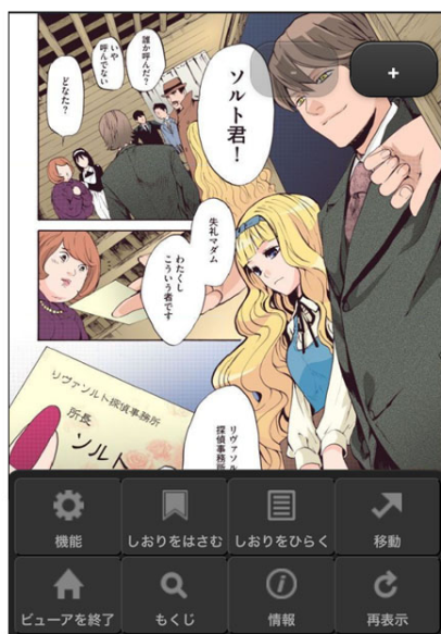
UIやデザインを自由にカスタマイズ可能