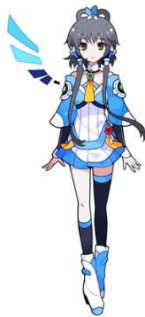
中国における新しい VOCALOID™キャラクター