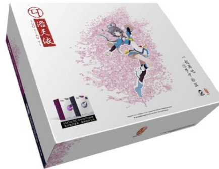
ボカロ作家向けマンガ・イラスト制作スペシャルパッケージ