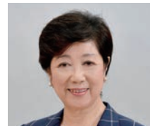
小池 百合子 東京都知事