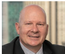
デイビッド・アトキン PRI(責任投資原則) 最高経営責任者