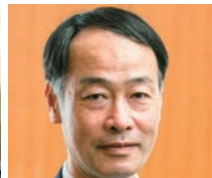
中島 淳一 金融庁 長官