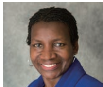
アンドレア・ドール 世界銀行 財務局資金調達責任者