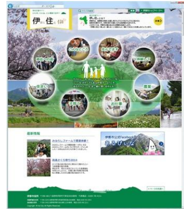
移住応援サイト「伊那に住む」