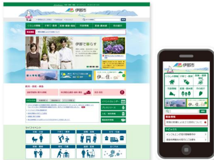
伊那市(長野県)のホームページ PC版/スマートフォン版

リニューアルにおいては、ホームページのアクセシビリティ(障がい者や高齢者などへの配慮)に関するJIS規格「ウェブアクセシビリティ JIS (JIS X 8341-3:2010)」の等級AA(一部等級AAAの達成基準を含む)に準拠し、自治体向けCMS(コンテンツマネジメントシステム)「4Uweb(フォーユーウェブ)/CMS」を、クラウドサービスで導入しました。