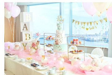
華やかなパーティーを演出する 卓上装飾(ピンク系イメージ)