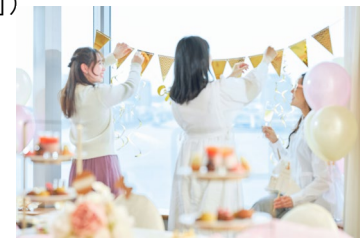
23階の開放的な養沢空間で 思い出に残るベビーシャワーに