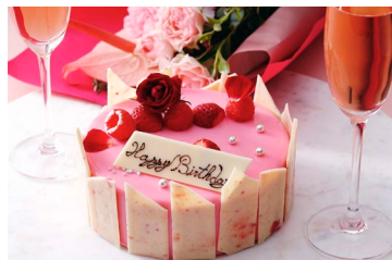
パーティーシーンにおすすめな スペシャルアニバーサリーケーキ(イメージ)