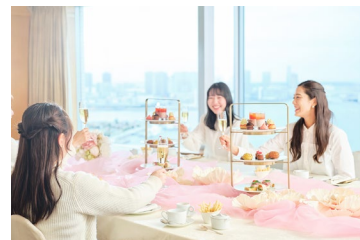
東京湾の空と海を一望する プライベート個室での女子会プラン