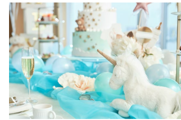
ブルー系・卓上装飾(イメージ)