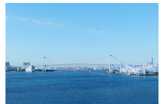
23階スカイビューバンケットから望む 東京湾の景色(イメージ)

アフタヌーンティー女子会プラン https://www.interconti-tokyo.com/privateroom/plan/ird-aft-joshikai.html