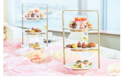
テーマカラー(ピンク系)のイメージ