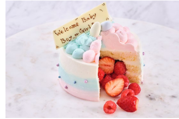
SNSで話題のジェンダーリビールケーキ(イメージ)