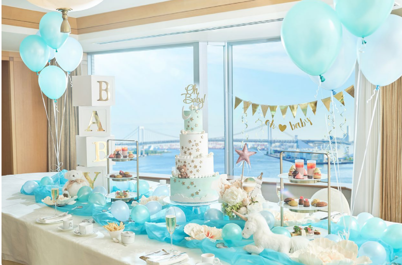
乾杯ドリンク、アフタヌーンティーなどの軽食、飲み物各種、バルーンなどの装飾がセットになったベビーシャワープラン

予約開始日：2024年1月23日(火) プラン開始日：2024年2月6日(火)～平日通年提供