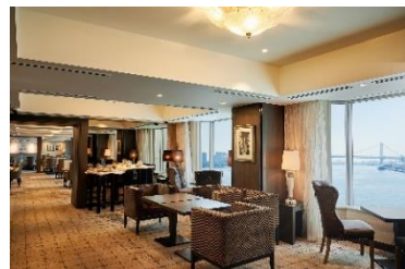
クラブインターコンチネンタルラウンジ(20階)