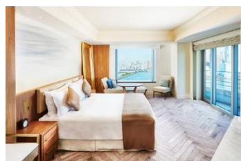
ジュニアスイートルーム

【ご予約・お問い合わせ】0570-000222(ナビダイヤル) https://www.interconti-tokyo.com/stay/plan/nohgaku.html