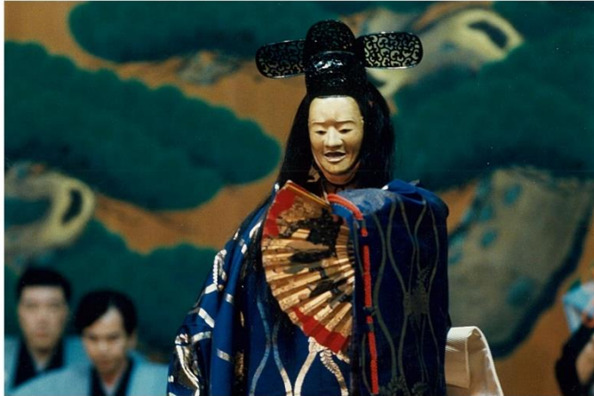
「能」について学ぶことができるワークショップがあり気軽に体験できる