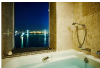
プレミアムルームのビューバス