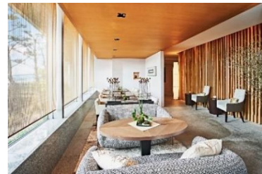
和-NAGOMI-ラウンジ(3階)内観

【添付資料】 主な出演者のプロフィール、ラウンジのサービスおよび部屋タイプについて、ホテル概要、インターコンチネンタル® ホテルズ&リゾートについて