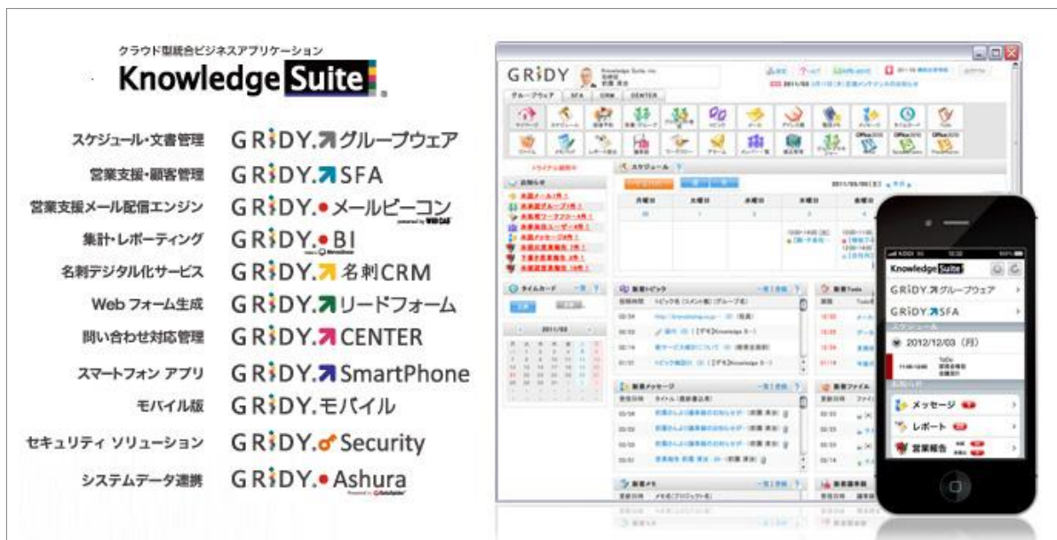
図3: クラウド型統合ビジネスアプリケーション Knowledge SuiteとGRIDY Ashura

強固な設備、24時間監視の国内データセンター/ISO27001を考慮した SaaS 設計/金融機関並みのセキュリティ対応