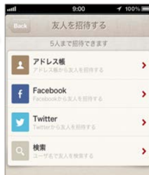
一緒にドライブしている友人を 招待することもできます