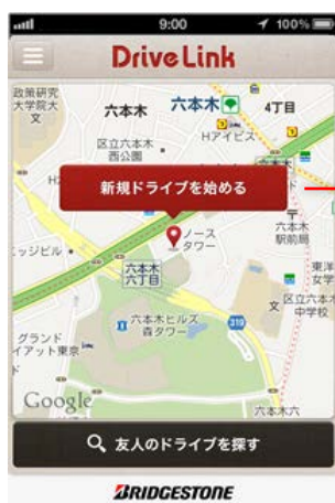
ドライブを始める前に 設定をしてください

ログイン後、新規ドライブの開始画面に移ります。「新規ドライブを始める」をタップしてドライブを始めましょう。