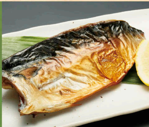
北海道・釧路ブランド 釧路鯖 くしろさば の一夜干し 税別 九九九円