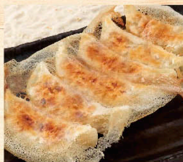
○富良野豚の焼き餃子 税別 三九九円