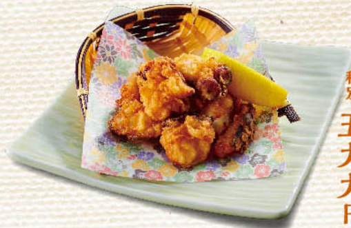
〇 北海 たこザンギ 税別 五九九円