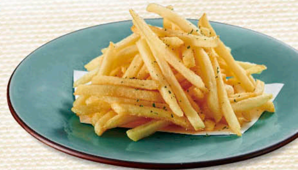
〇 フライドポテト 税別 四九九円