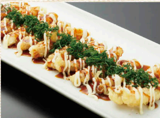
〇 ぴりっと マヨイカ天 税別 四九九円