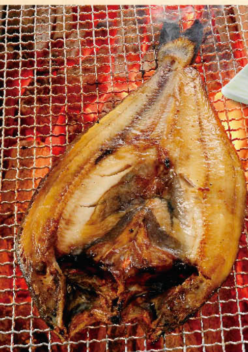
○特大ほっけ焼き 税別 一、二九九円