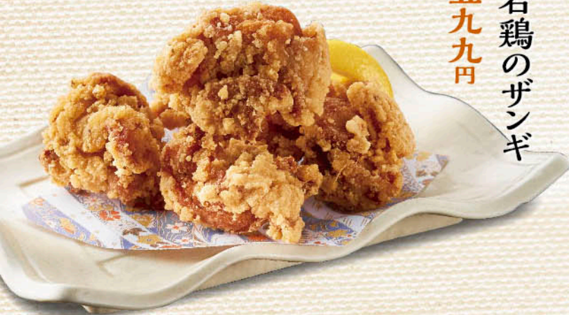
〇 若鶏のザンギ 税別 五九九円