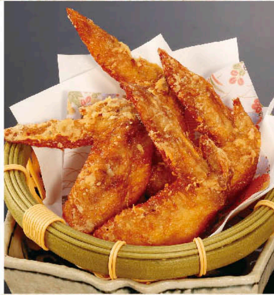
〇 十勝鶏の手羽先 とかもどり スパイス揚げ 税別 五九九円

1平方メートル1羽の放し飼いで、飼育期間は120日間という環境で、長期間よく運動して伸び伸び育った十勝鶏は、筋肉質でシコシコとした歯ざわりで赤身が強く甘さはいばいばです。噛めばジュワ〜と旨い肉汁が口いっぱいに広がり、とても香ばしいおいしさ。低脂肪で低カロリー、高タンパクでビタミン類、コラーゲン、コンドロイチンが豊富です。