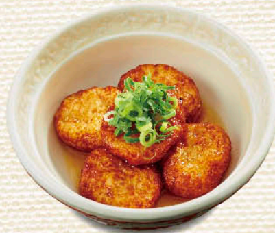
〇 青森産ホタテの 自家製さつま揚げ 税別 五九九円