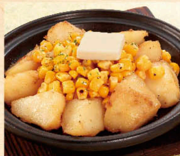
○じゃがバター コーン 税別 四九九円