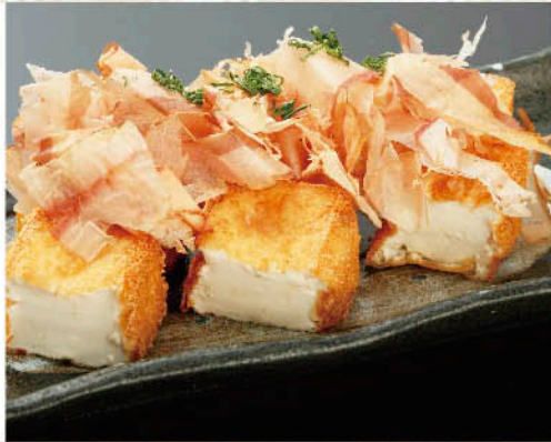
〇 揚げたて! 北海道産 豆乳の厚揚げ 税別 四九九円