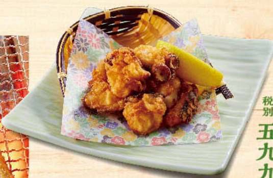
○北海たこザンギ 税別 五九九円