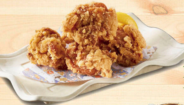
○若鶏のザンギ 税別 五九九円