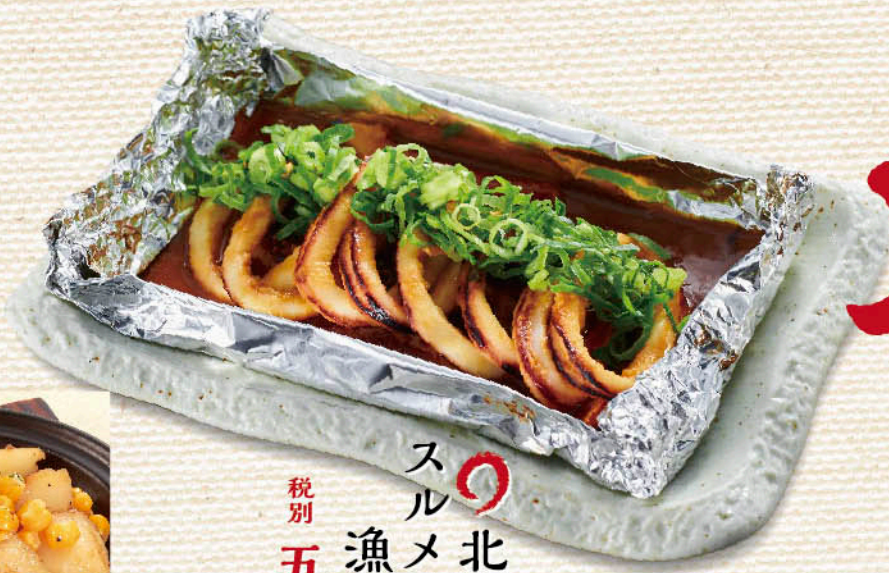
北海道産 スルメイカの 漁師焼き 税別 五九九円