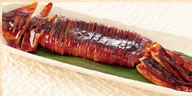
○北海道産スルメイカの照焼き 税別 六九九円