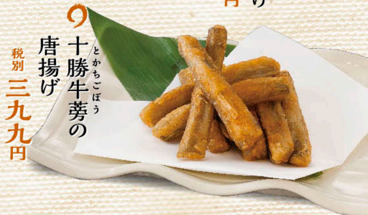
〇 十勝牛蒡の 唐揚げ とかもどり 税別 三九九円