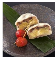
郷土菓子 いきなり団子 380円