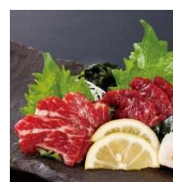
熊本名物 馬刺し盛合せ 1,480円