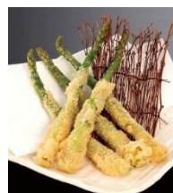
熊本 アスパラ 1本揚げ 1本 198円