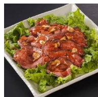
熊本 あか牛 ローストビーフ 980円