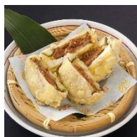
熊本 赤なすの あか牛ミンチ 挟み揚げ 580円