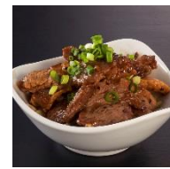
売切御免 肉盛り小鉢 380円