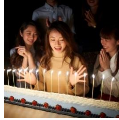
記念日ロングケーキイメージ