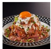
ローストビーフ 丼ぶり ごつ盛り 1280円 ミニ 580円