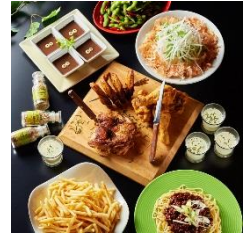
パーティーコース ¥2980～