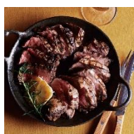
拷問ステーキ アイアンメイデン 1850円