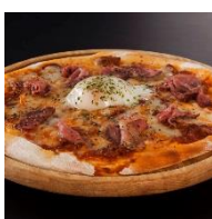
肉食 P I Z Z A ビスマルク 780円