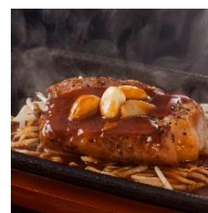
囚人感涙 超厚切とんてき 780円